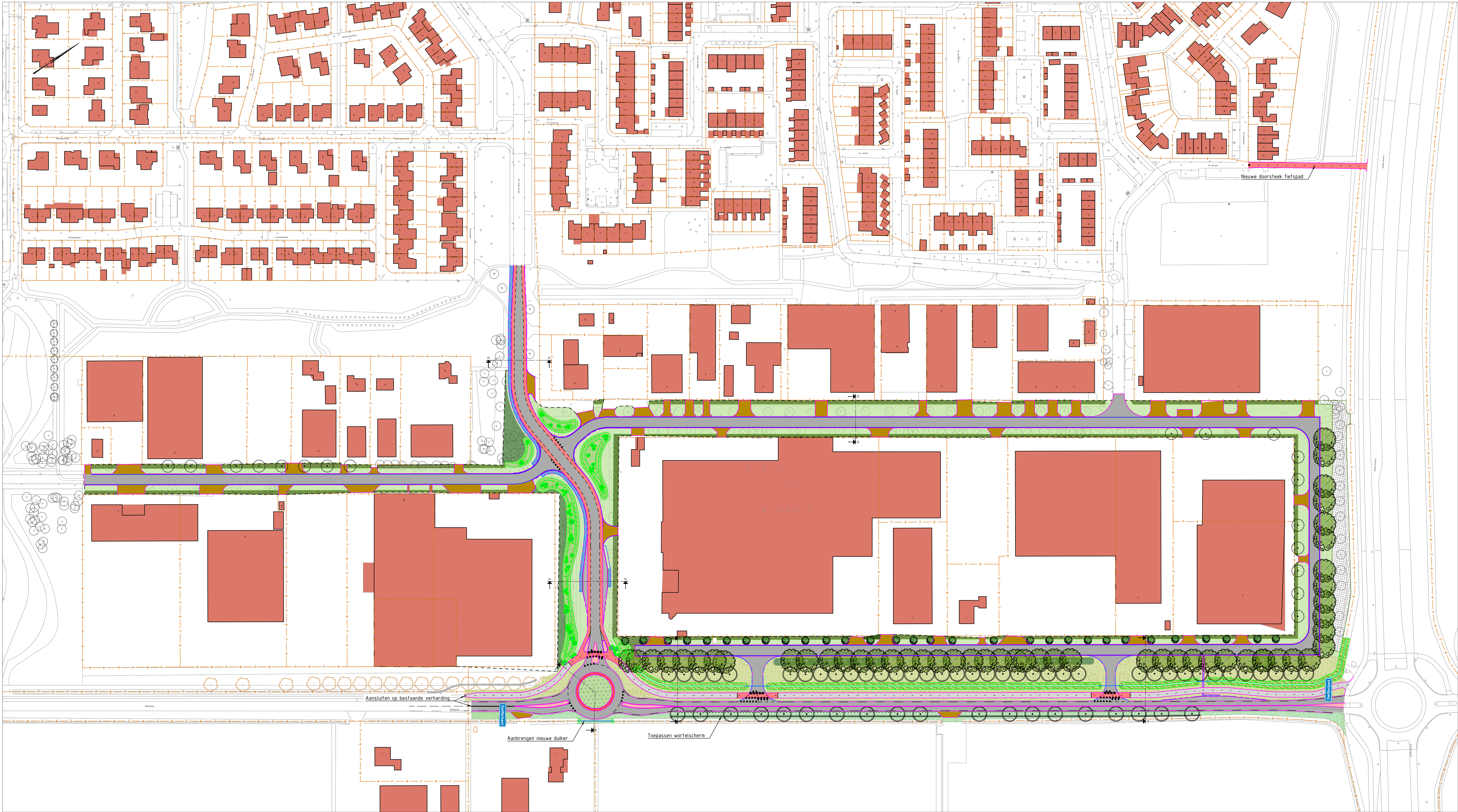
Situatie SCHAAL 1 : 1000